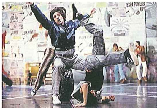
Tanz und Schauspiel: Die Tanzkompanie legt sich in Marco Santis «Pasolini» ganz besonders ins Zeug.

im Foyer einen lauten Vorgeschmack auf die eineinhalbstündige Aufführung, die atemlos schnell, faszinierend und keine Sekunde langweilig war.