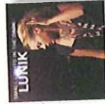
Lunik «Small Lights in the Dark»